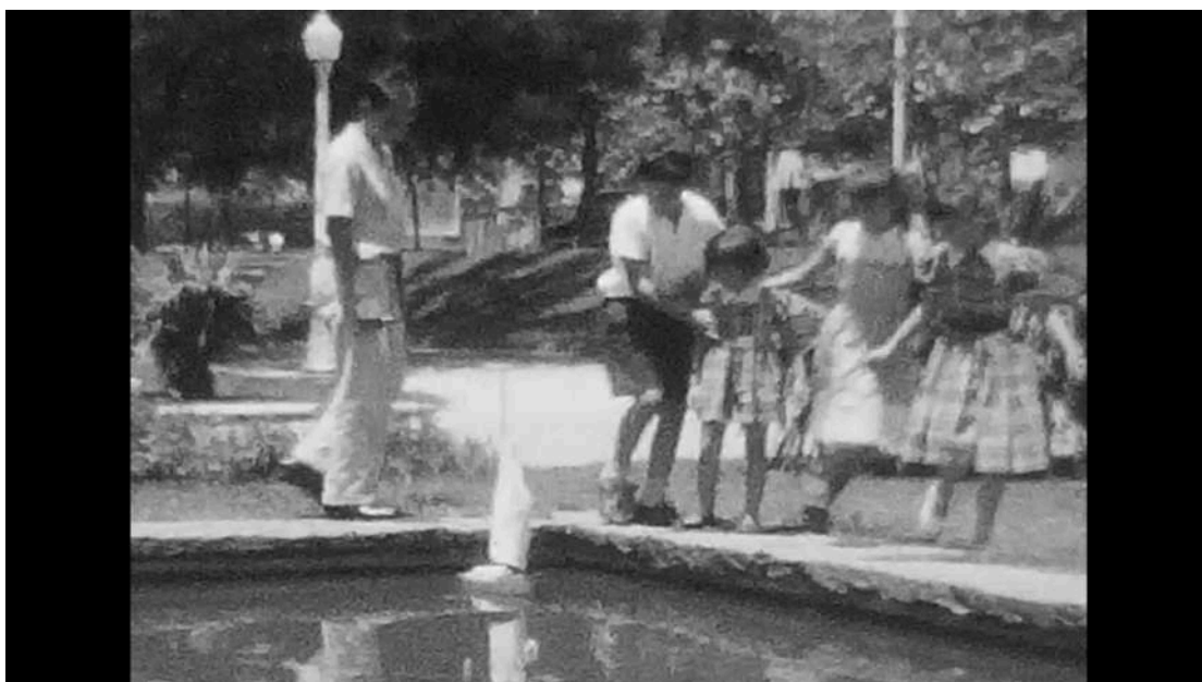
Imagem 2

Se os arquivos podem ser vistos como paisagens, talvez sejam paisagens em ruínas. Mas o que, afinal, é uma ruína? Segundo Rebecca Solnit, uma ruína é uma construção humana abandonada à natureza, e que portanto é sedutora por ser selvagem – um lugar cheio de promessas do desconhecido, com suas epifanias e perigos. Ruínas se transformam no inconsciente de uma cidade, sua memória, desconhecida, escura, perdida, e em sua potência de trazê-la de volta à vida. Talvez por isso tenhamos tanto pudor em viver as experiências dos arquivos. Por seus riscos e seus perigos. Mas o medo de fazer erros pode ser um grande erro, um que nos previne de viver, pois a vida é arriscada e a todo momento estamos lidando com a perda.