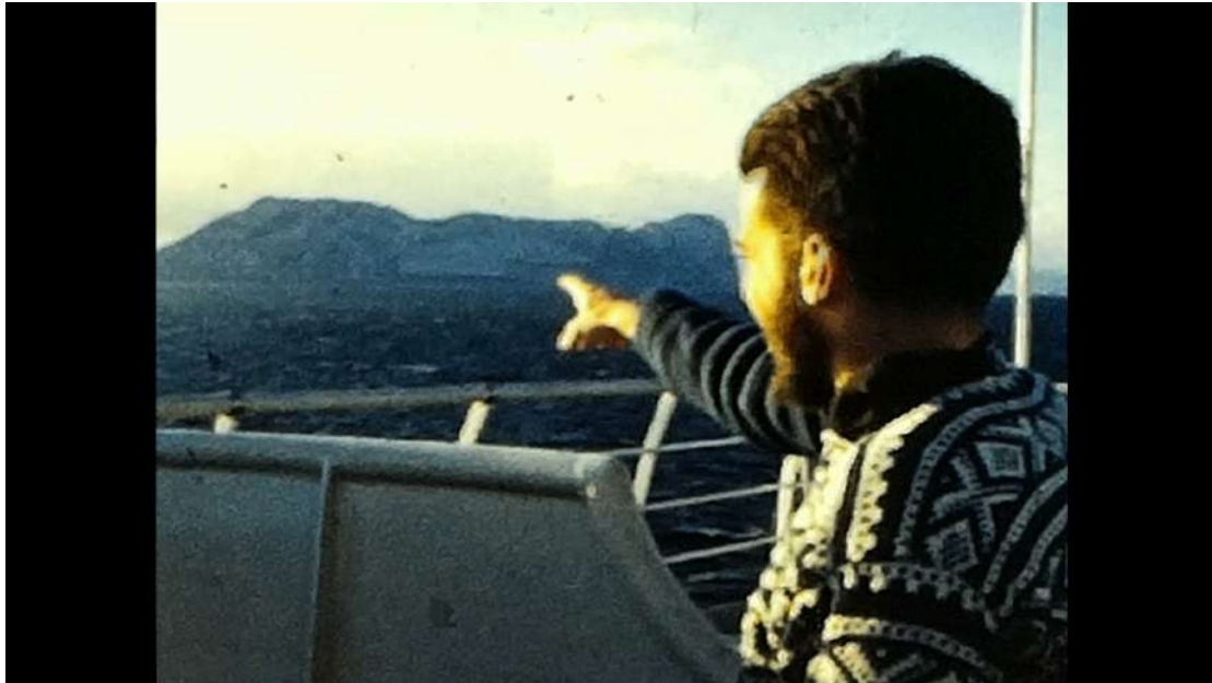
Imagem 1

fundamental, a de que ela é uma relação, e não uma coisa, uma ligação entre os homens, e ao mesmo tempo o reflexo de sua atividade.” (Tiberghien 2012, 180)